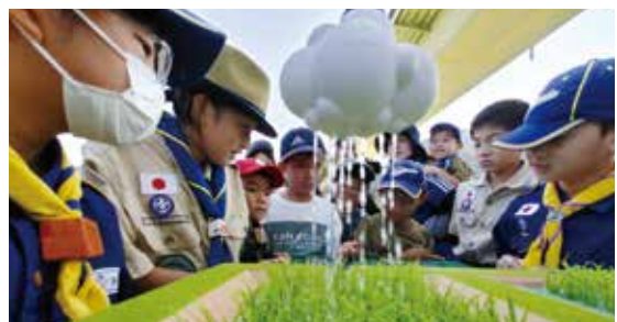
模型を使った学習風景