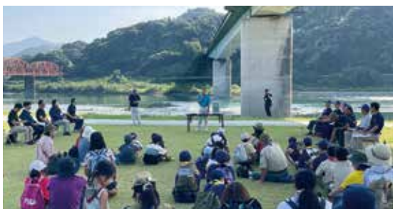
遥拝八の字広場にて開会

県内小学生親子を対象に水資源の保全などを学んでもらうため熊本県未来につなぐふるさと応援事業を活用し、「森林の学校inやつしろ」を開催しました。