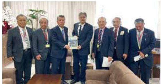
長井農村振興局長へ要望