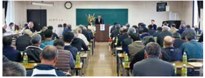
第59回通常総代会時の様子

令和6年3月14日(木)午前9時より、当土地改良区において熊本県南広域本部農地整備課長及び、八代市農地整備課主査、氷川町農地課長のご出席のもと、第59回通常総代会が開催されました。令和5年度補正予算及び令和6年度予算など全11議案について慎重審議され、全て原案のとおり承認・可決されました。