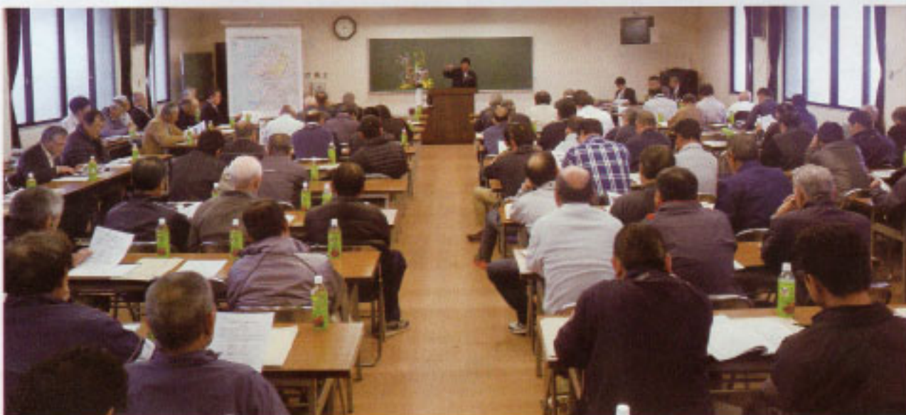
第50回 通常総代会時、多面的機能支払交付金研修事例発表の様子