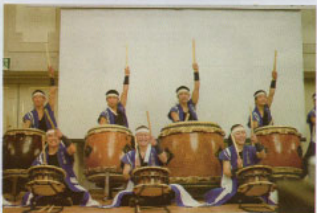
雅太鼓（秀岳館高等学校）